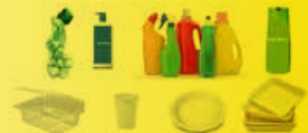
Imballaggi e contenitori in plastica RICICLABILE

TUTTI GLI IMBALLAGGI E I CONTENITORI IN PLASTICA, BOTTIGLIE (ES. ACQUA, BIBITE, LATTE, SUCCHI), CONFEZIONI E BUSTE PER ALIMENTI (ES. PASTA, SALATINI,...), BUSTE E SACCHETTI PER LA SPESA, FLACONI E DISPENSER (ES. DETERSIVI, DETERGENTI E SHAMPOO,...), POLISTIROLO DA IMBALLAGGIO, TUBETTI DI DENTIFRICIO, PELLICOLE E FILM IN CELLOPHANE, GRUCCE APPENDIABILI, RETI FRUTTA E VERDURA. PIATTI E BICCHIERI DI PLASTICA, VASCHE E ALTRI CONTENITORI IN PLASTICA PER ALIMENTI, ANCHE SE SPORCHI VANNO NELLA PLASTICA. NON OCCORRE LAVARLI, L'IMPORTANTE È CHE NON CI SIANO RESIDUI CONSISTENTI DI CIBO.